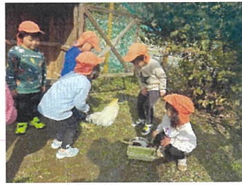
らいおん組 うこっけいのお世話