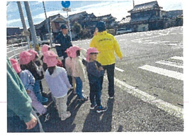
とら組 交通安全教室