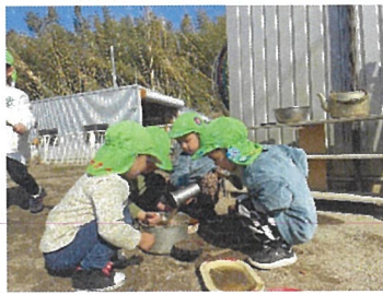
きりん組 みんなでままごと