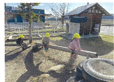
うさぎ組 一本橋ステップアップ