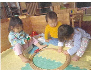
らっこ組 みんなで電車あそび