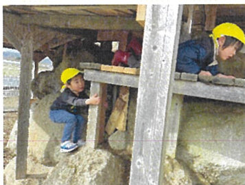
こあら組 どこから登ろう？