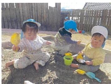
ひよこ組 砂場楽しいね