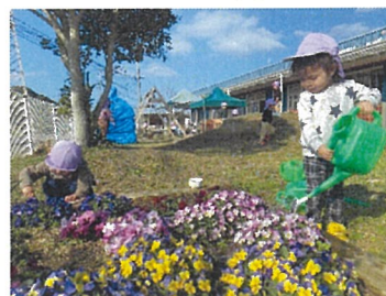
りす組 お花に水あげようね