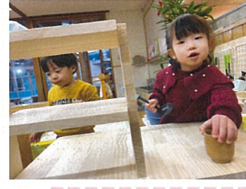
ごっこ遊び楽しいな！