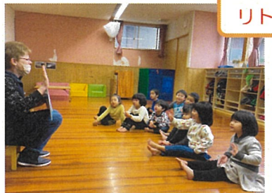
絵本面白かったね☆