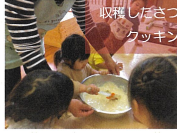
収穫したさつまいもで クッキング！