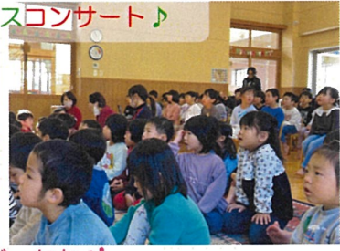
素敵な時間だったね☆