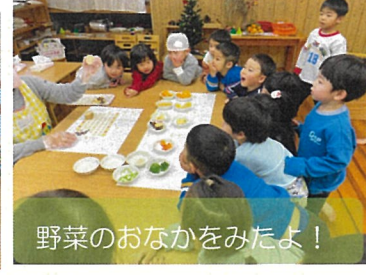
野菜のおなかをみたよ！