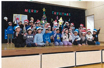
クリスマスコンサート