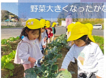
野菜大きくなったかな？