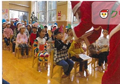
サンタさんが来たね☆