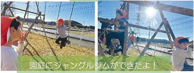
園庭にジャングルジムができたよ!