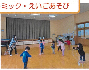
上手に回せるかな？