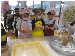
みんなの前で発表☆