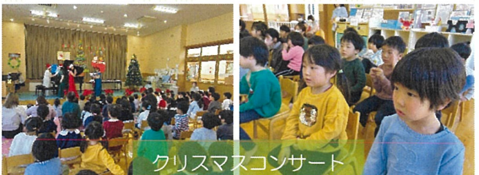
クリスマスコンサート