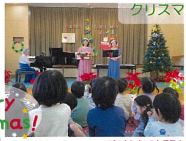
クリスマスコンサート♪