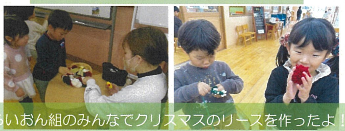
らいおん組のみんなでクリスマスのリースを作ったよ!