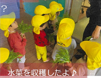
野菜を収穫したよ！