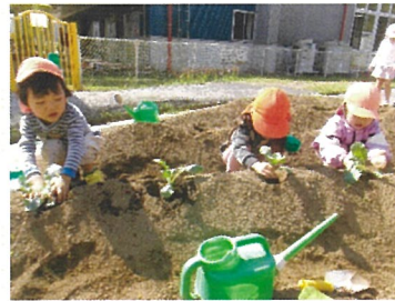
らいおん組 冬の野菜植えたよ