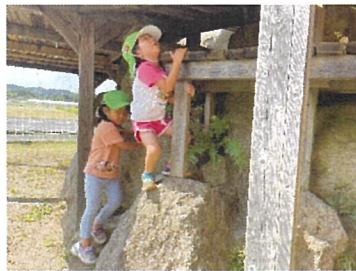
きりん組 どうやって登ろうか？