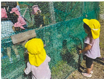
こあら組 なにしてるの？

以上について再度ご確認・徹底ををよろしくお祈いします。（発見し次第、お声を掛けさせていただきます。）