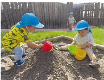
ひよこ組 砂場楽しいね