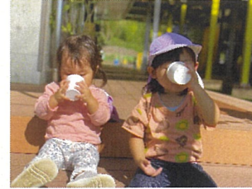
らっこ組 ちょっと一休み