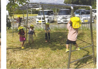
うさぎ組 雲梯やってみる？