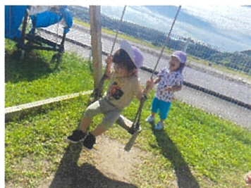
りす組 ブランコこいであげる