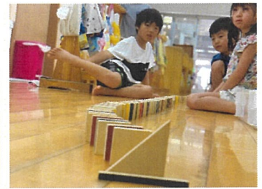
とら組 ドミノ慎重に並べたよ