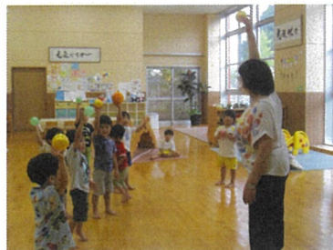
リトミックでボール遊びしたよ！