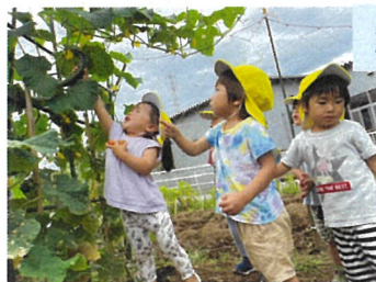
たくさん育ったね!