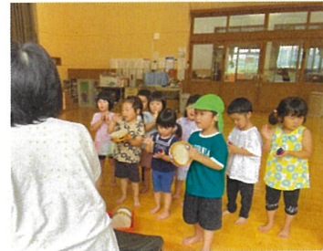
楽器を鳴らしたよ！