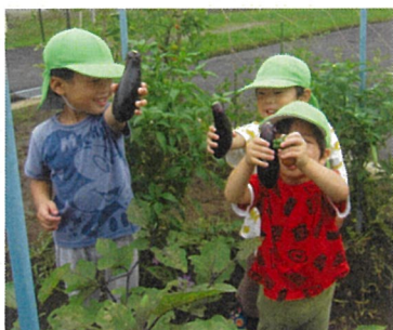
お野菜収穫したよ！