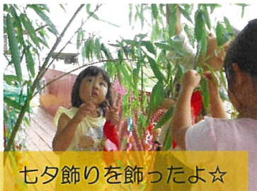
七夕飾りを飾ったよ☆