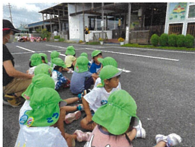
避難訓練上手に出来たよ！