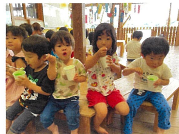
かき氷おいしいね！