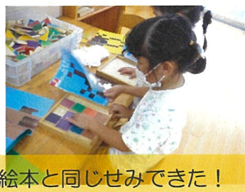
絵本と同じせみできた！