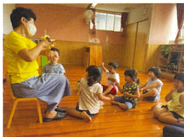
おはなクラブ楽しかったね☆