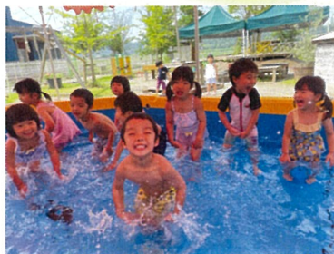
プール気持ちいいね♡