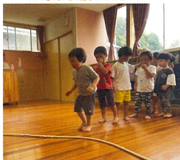
上手に飛べるかな？