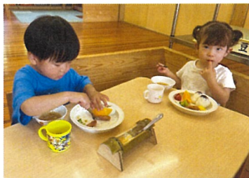
そうめん美味しいね♪