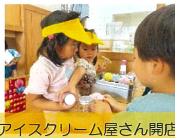
アイスクリーム屋さん開店！