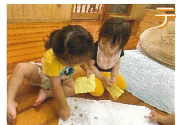
テラス・室内遊び