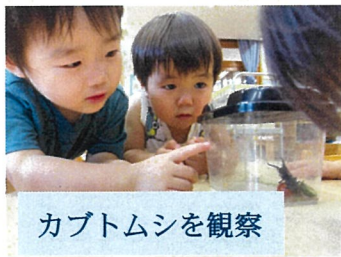
カブトムシを観察