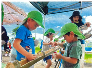
そうめん流ししたよ！