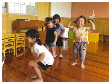
えいごあそび楽しいね！