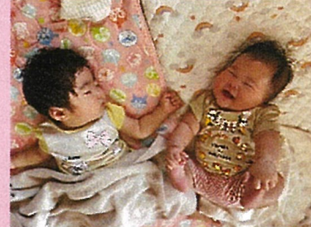
アスレチックマット