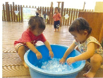
らっこ組 水冷たくて気持ちいいね