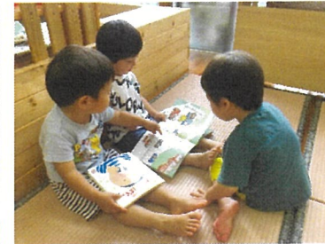
うさぎ組 みんなで絵本読み