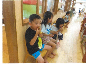
とら組 採れたてミニトマトをバクリ