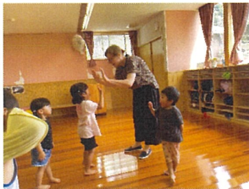
きりん組 えいごあそびでハイタッチ！