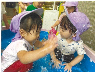
りす組 みずしぶきぱっしょん