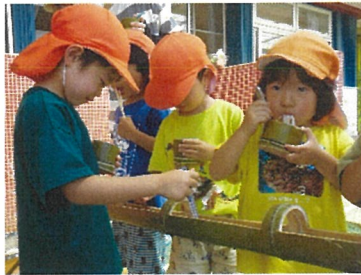
らいおん組 ながしそめんおいしい！