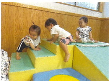
ひよこ組 登ったり降りたり