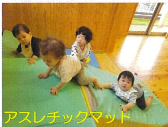
アスレチックマット