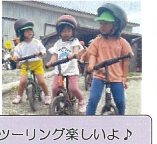
ツーリング楽しいよ♪