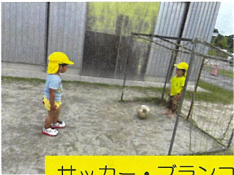
サッカー・ブランコに挑戦！上手でしょ？