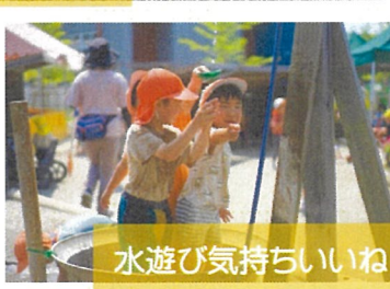
水遊び気持ちいいね！