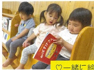
♡一緒に絵本見ようよ♡