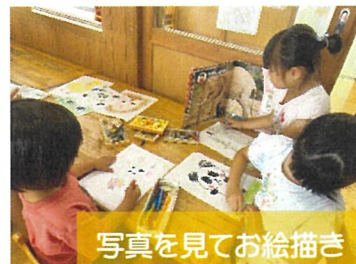
写真を見てお絵描き