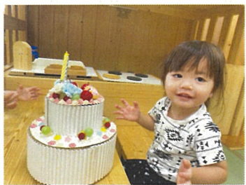
お誕生日おめでとう♡