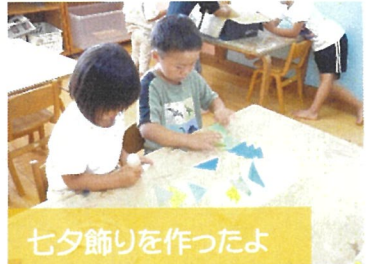
七夕飾りを作ったよ