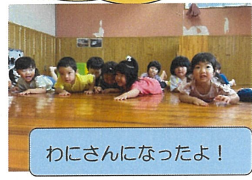
わにさんになったよ!