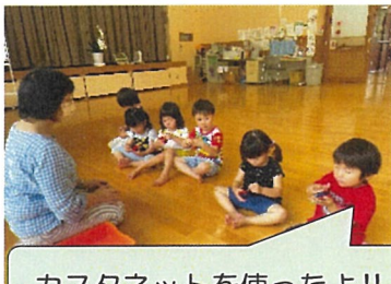
カスタネットを使ったよ!!