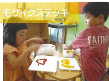
モザイクステッカー