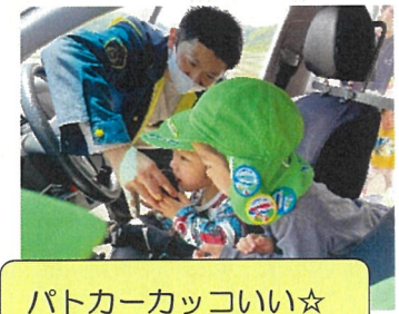
パトカーカッコいい☆