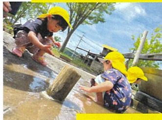
園庭でたくさん遊んだよ♪