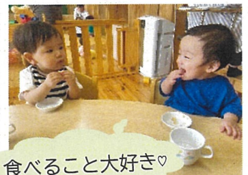
食べることを大好き♡