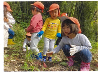
ばんだ組 芋ほりたくさんあるかな?