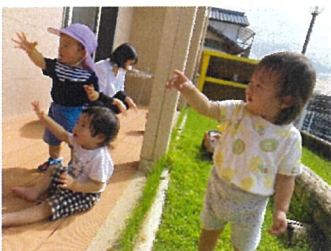
ひよこ組 シャボン玉きれい