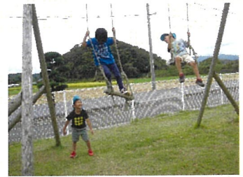
とら組 ブランコ最高!