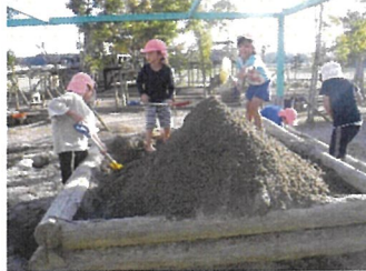
らいおん組 大きな山作るぞ