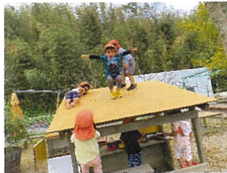
きりん組 やっほーここだよー