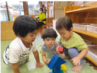
こあら組 積み木上手に積めるかな?