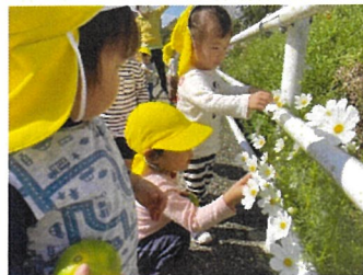
らっこ組 コスモス咲いてるね