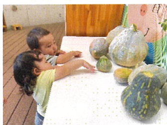
りす組 大きなカボチャに興味津々!