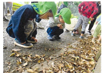
うさぎ組 いいもの見つけた?