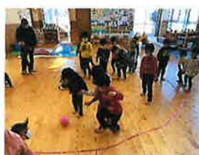
ぱんだ組 とら組さんと転がしドッジしたよ