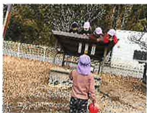
とら組 屋根の上でまったりと

現在みなさんに写真や動画を配信しているドロップボックスでログインできない、動画の視聴・保存ができない等が発生しているようです。ご不明な点があれば職員にお尋ねいただくようお願いいたします。