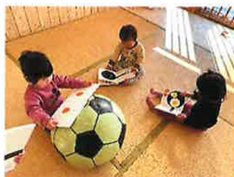
らっこ組 えほんだいすき