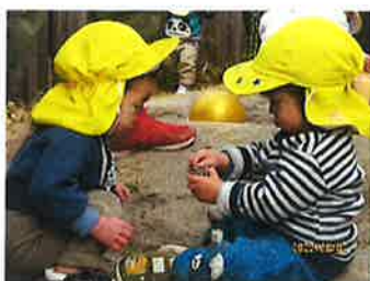
ひよこ組 砂場あそび