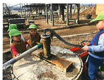
りす組 どうやったら水が出る？