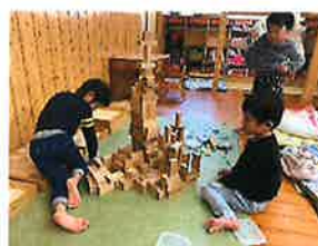
きりん組 積み木みんなで協力