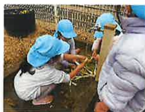
らいおん組 大根みんなで洗おう