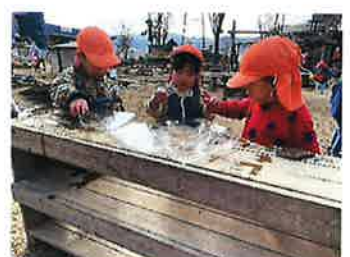
うさぎ組 大きな米すこいね