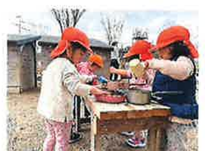
こあら組 ままごと楽しいね