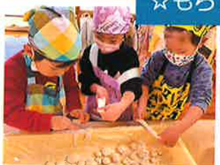
団子のはすの難しいね～