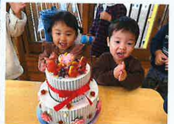
お誕生日おめでとう♪