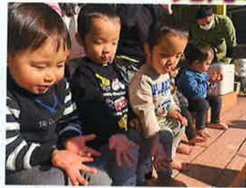
お餅おいしかったね