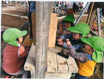
いらっしやいませ〜