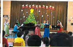
クリスマスコンサート♪