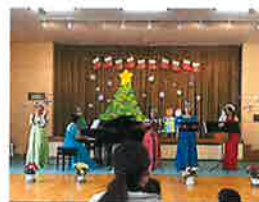
クリスマス コンサート♪