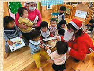
メリークリスマス!!