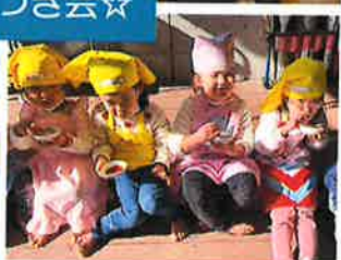
つきたてのお餅おいしい♡