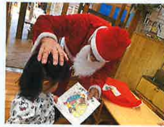
サンタさんきたよ♡