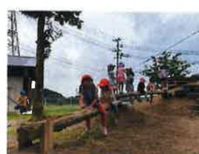
うさぎ組 一本橋まずはここから