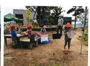
こあら組 洗濯ごっこ楽しいね