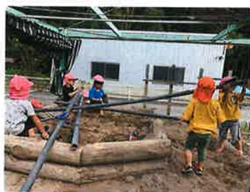
ぱんだ組 どうやったら水が流れる？