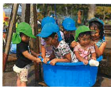
らいおん組 ぎゅうぎゅうづめだね