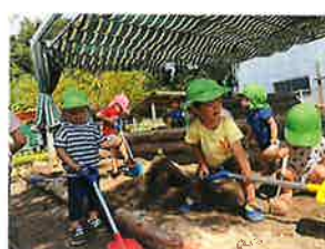
りす組 スコップ便利だね