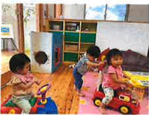
ひよこ組 クルマ押してあげるね