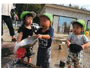
らっこ組 これで汲めるかな