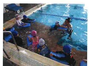
とら組 スイミング楽しい