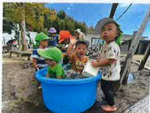
水遊び気持ちいいね