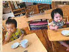
おやつ美味しいよ!