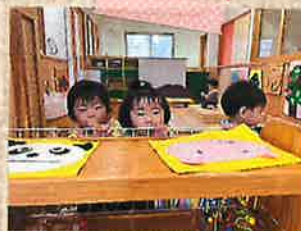
いないいないばあ!!