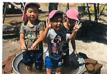
絵の具を使って・・・♪