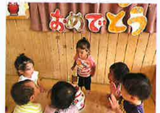
お誕生日おめでとう♪