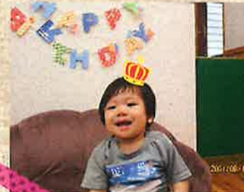
おたんじょうび おめでとう♡