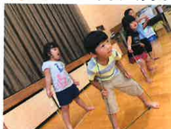
あそび一会！上手にボール運べたよ♡