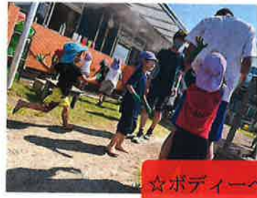
☆ボディーペインティング☆