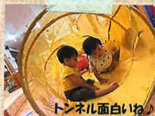
トンネル面白いね!