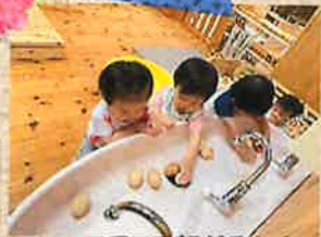
コロコロ転がるよ!