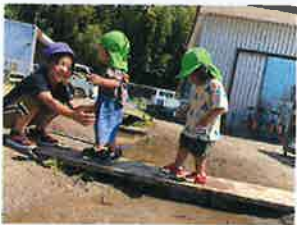
お姉ちゃん大好き