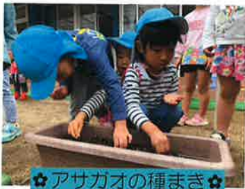
☆アサガオの種まき☆