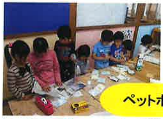
ペットボトルで鉄砲作り