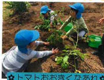
☆トマトおおきくなあれ☆