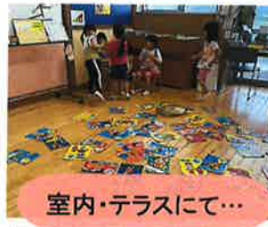
室内・テラスにて...