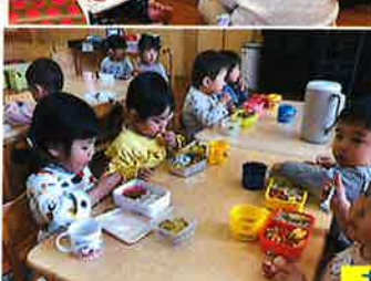
お弁当、美味しかったよ!