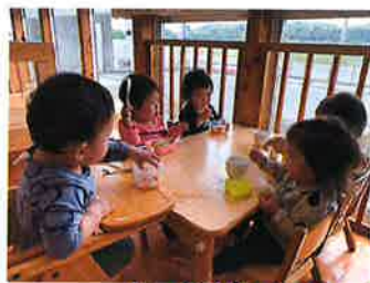
お弁当おいしかったよ～！