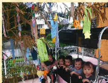
願い事が叶いますように・・・