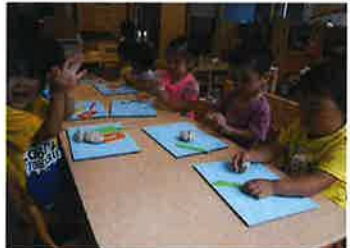
粘土やはさみあそび