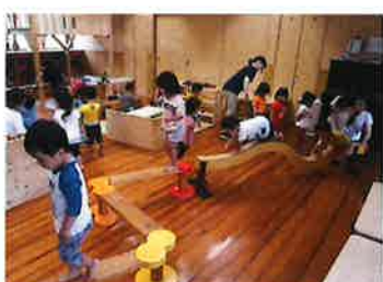
平均台やトランポリン遊び