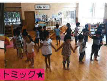
★うなぎおいしそう★