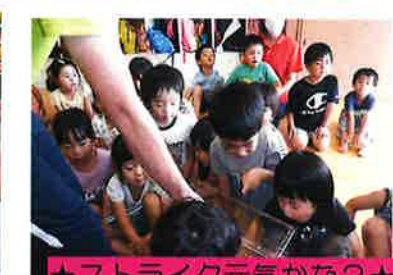
★ストライク元気かな?★