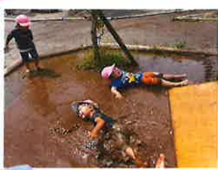
雨上がりの水たまり！楽しいね♪