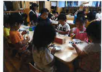
雨の日の室内では…