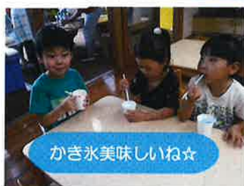
かき氷美味しいね☆