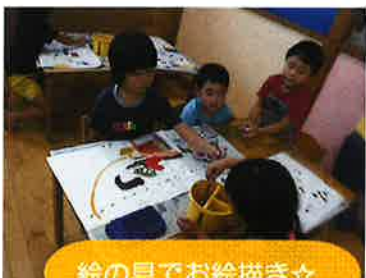
絵の具でお絵描き☆