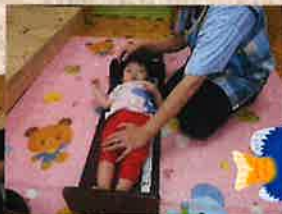
お父さん、お母さんと一緒に、嬉しいなあ♪