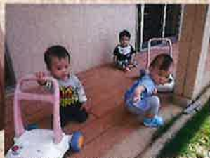
お外は気持ちいいね〜