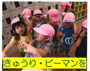
きゅうり・ピーマンを