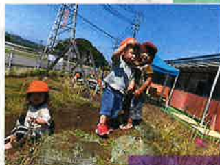
築山からヤッホー!!!