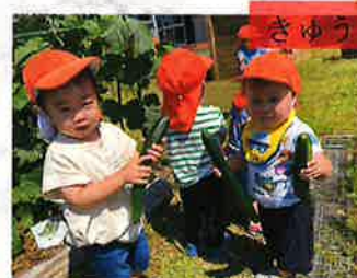
きゅうり収穫したよ