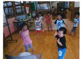
ご参加ありがとうございました！