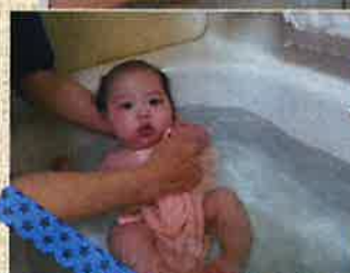
★4月生まれのお友だち★