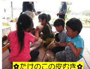
✿たけのこの皮むき✿