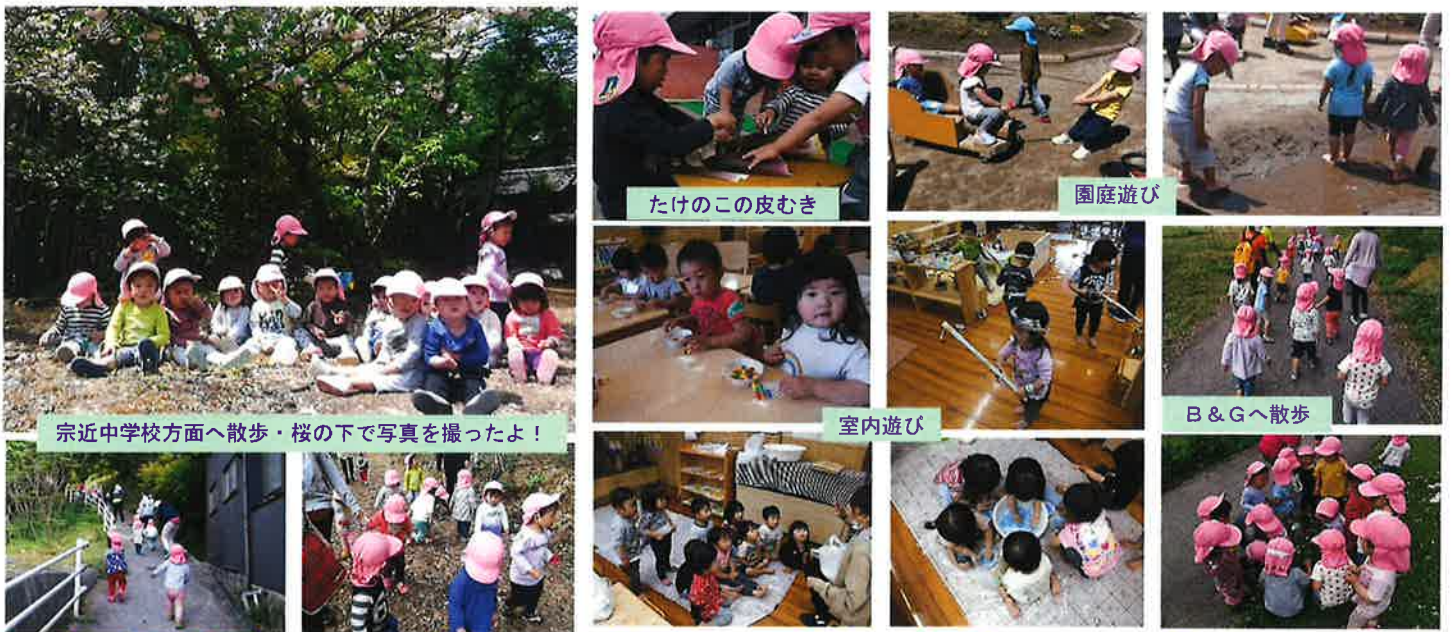
たけのこの皮むき