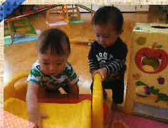
★センターで遊んだよ!★