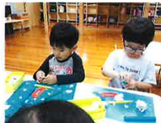
ミミズさんいるかな～？