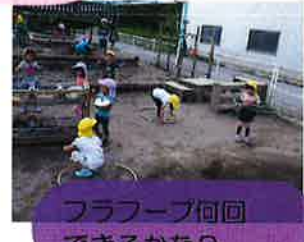
フラフープ何回できるかな?