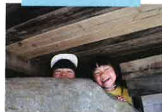
☆岩山からひょっこり☆