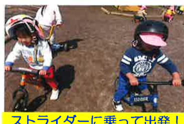
ストライダーに乗って出発!