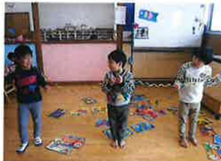
☆LaQ で長いへび作ったよ