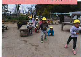
☆だるまさんがころんだ☆