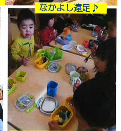
お弁当美味しかったよ!