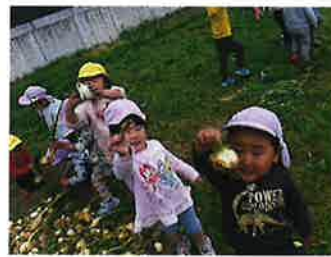
水車の前で食べたよ!