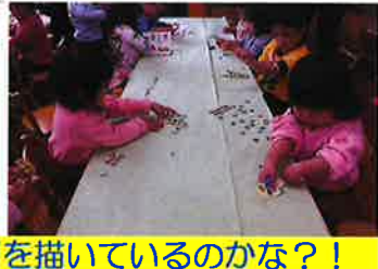
何を描いているのかな?!