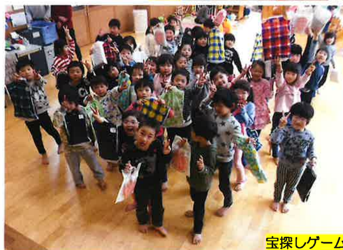
宝探しゲーム・散歩