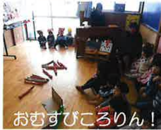
おむすびころりん!