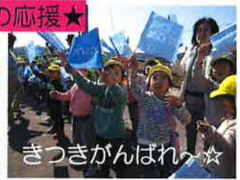
きつきがんばれん☆