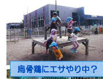
烏骨鶏にエサやり中?