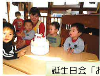
誕生日会「おめでと〜」