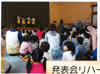
発表会リハーサル