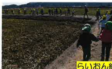
らいおん組と駅伝の応援