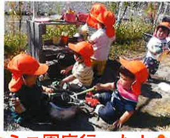
✿ミニ園庭行ったよ✿