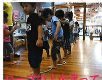
ロープの上を渡って