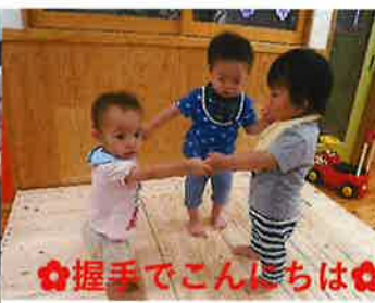
✿握手でこんにちは✿