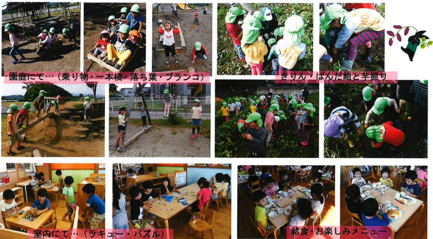
園庭にて…(乗り物・一本橋・落ち葉・ブランコ)