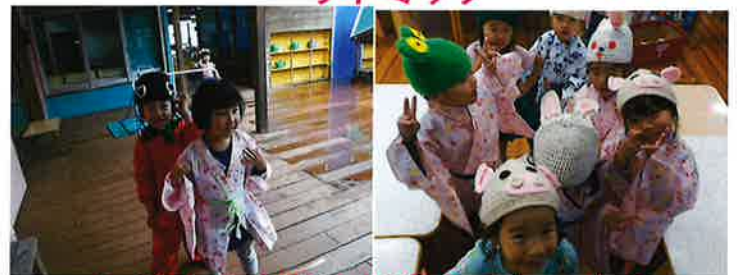
いろいろな衣装! 似合うでしょ!?