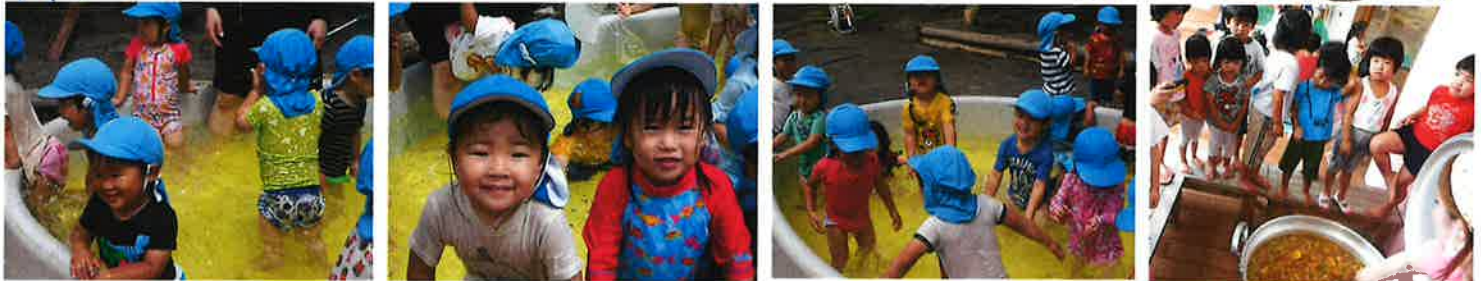
プール、気持ちいいよ♡