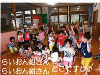
らいおん組さん らいおん組さん すごいですか♪