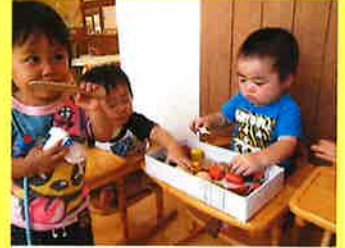
いらっしやいませ〜！