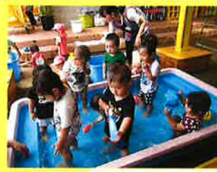
プール遊びたのしいな〜！