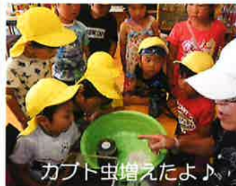
カブト虫増えたよ♪