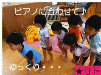
ピアノに合わせて♪