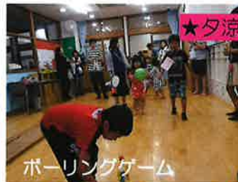
ボーリングゲーム