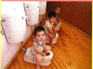
トイレでおしっこ出たよ♪