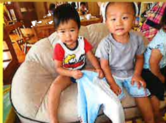
ひっばれ〜ぐい！上手でしょ？