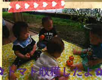
トマト収穫したよ