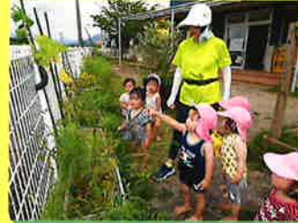
みてみて！きゅうり！