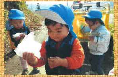
散歩でどんぐりみ〜つけた！