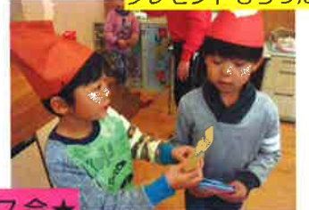
プレゼントもらったよ!