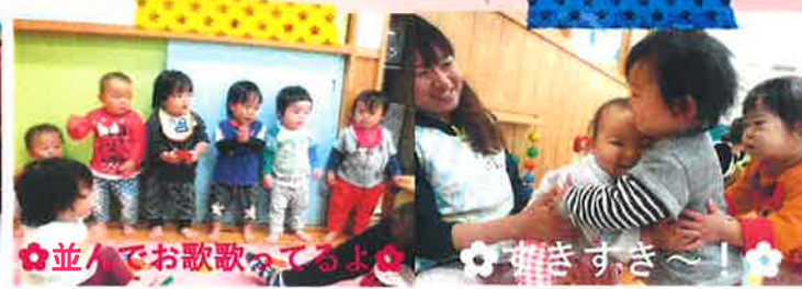
並んでお歌歌ってるよ