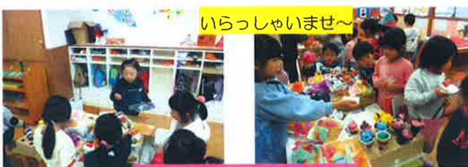
☆お店屋さんごっこ☆