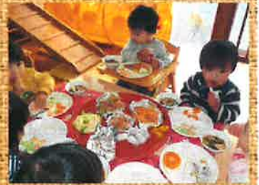
クリスマスのオードブル、おいしかったよ♡