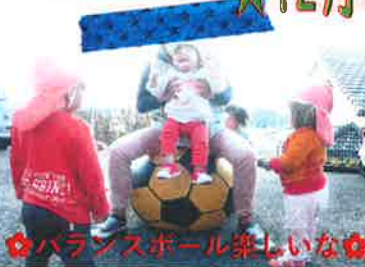
バランスボール楽しいな