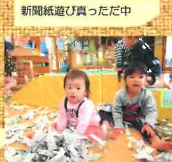
新聞紙遊び真った中