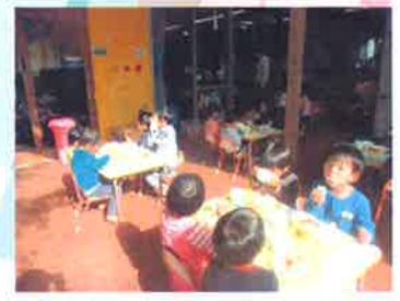
おもち・団子汁美味しい～☆