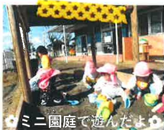
ミニ園庭で遊んだよ