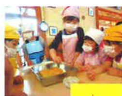
ケーキ作りしたよ！