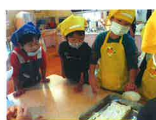
ケーキを飾り付けたよ♪