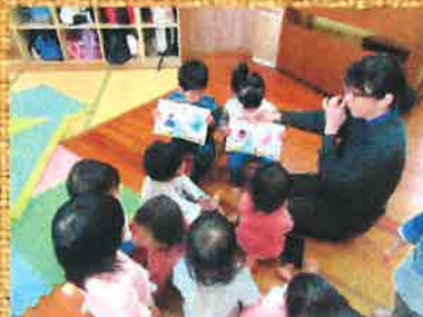
みんなでお祝いしたよ