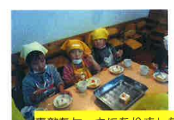
素敵なケーキになりました♡