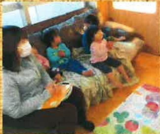
素敵な音楽に興味深々な子どもたちでしたよ♪