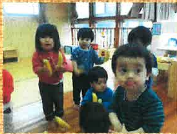
バナナマラカスを持ってノリノリ♪