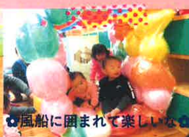
風船に囲まれて楽しいな