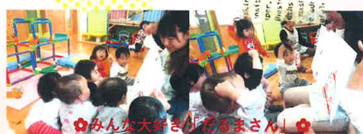
みんな大好き「だるまん」