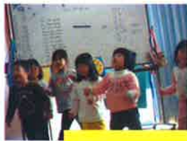
みんなで踊るの楽しいね！