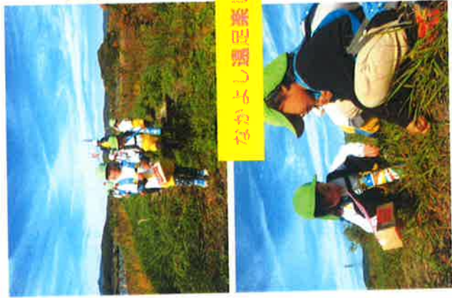
なかよし遠足楽しかったね!