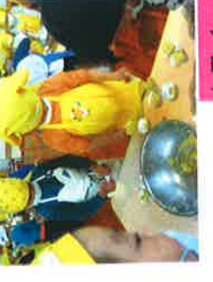
☆スイートポテト作り★