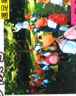
♪遠足楽しかったよ！！