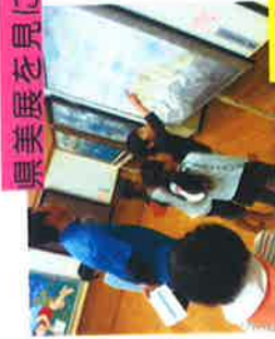
☆県美展を見に行ったよ♪