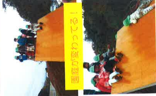
園庭が変わってる!