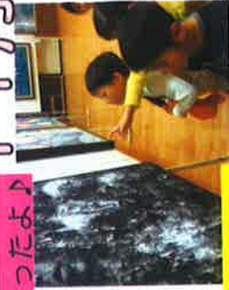
♪いろんな絵があるね！