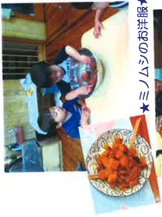
★ミニムシのお洋服★