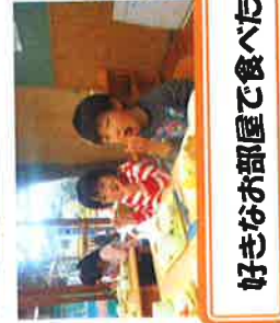
好きなお部屋で食べたよ♪