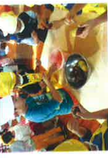
♪お手を使ったクッキング♪