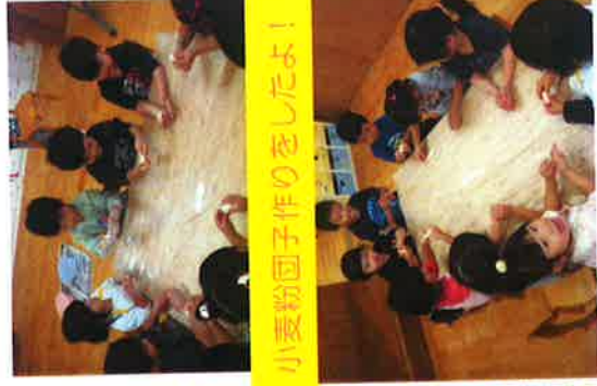
小麦粉団子作りをしたよ!