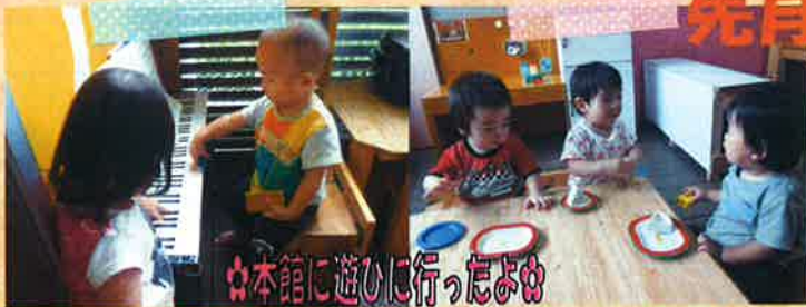
☆本館に遊びに行ったよ☆