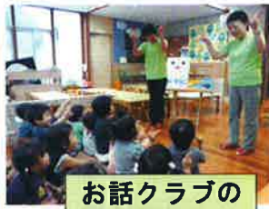
お話クラブの読み聞かせ