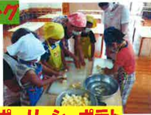
ポーリッシュポテト