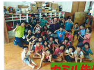
カミル先生のお別れ会