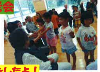
ふれあいをしたよ!