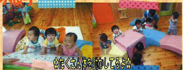
☆たくさん体を動かしてるよ☆