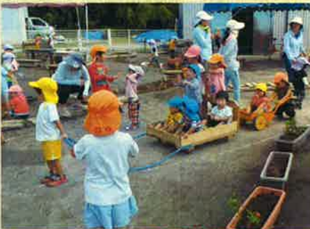
何だかパレードみたいですね