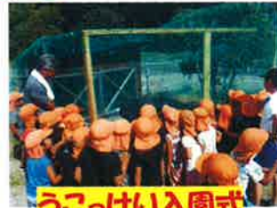
うごっけい入園式